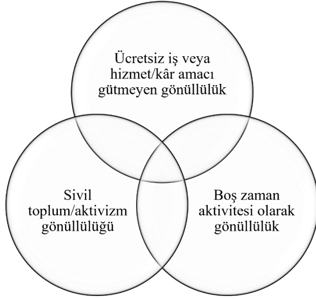
Şekil 1. Gönüllüğün Üç Perspektif Modeli (Rochester ve ark., 2012: 15)

Rochester ve arkadaşlarına (2012: 15) göre paradigmaların her biri gönüllü eylemin belirli bir bölümünü ele almakta ve gönüllülüğün kapsamını yeterince yansıtmamaktadır. Gönüllü eylemler incelendiğinde, kimi zaman belirtilen iki alanın kimi zamansa üç alanın kesiştiği gözlemlenmektedir. Dolayısıyla gerçekleştirilen gönüllü eylem aynı anda hem ücretsiz bir hizmet hem aktivizm hem de bir boş zaman aktivitesi olabilir.