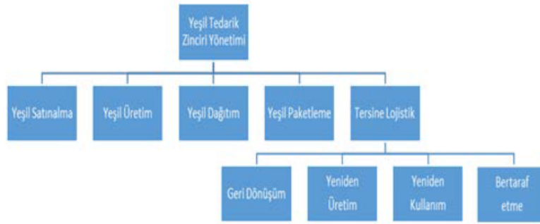
Şekil 2. Yeşil tedarik zinciri yönetimindeki yeşil uygulamalar

Şekil 2’de yeşil tedarik zinciri yönetiminde kullanılan, yeşil uygulamalar şematize edilmiştir.