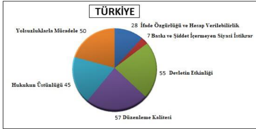
Şekil 2:Yönetişim Göstergeleri Türkiye

Şekil 2’de Türkiye’nin yönetim oranlarının dağılımı grafik şeklinde gösterilmiştir. Yönetişim göstergeleri skorlarına göre sıralanırsa (Şekil 2): (1) Düzenleme Kalitesi, (2) Devletin Etkinliği, (3) Yolsuzluklarla Mücadele, (4) Hukukun Üstünlüğü, (5) İfade Özgürlüğü ve Hesap Verilebilirlik, (6) Baskı ve Şiddet İçermeyen Siyasi İstikrar. Görüldüğü üzere Türkiye’de yönetim göstergeleri kapsamında ilk sırada “Düzenleme Kalitesi” son sırada “Baskı ve Şiddet İçermeyen Siyasi İstikrar” göstergesi yer almaktadır.