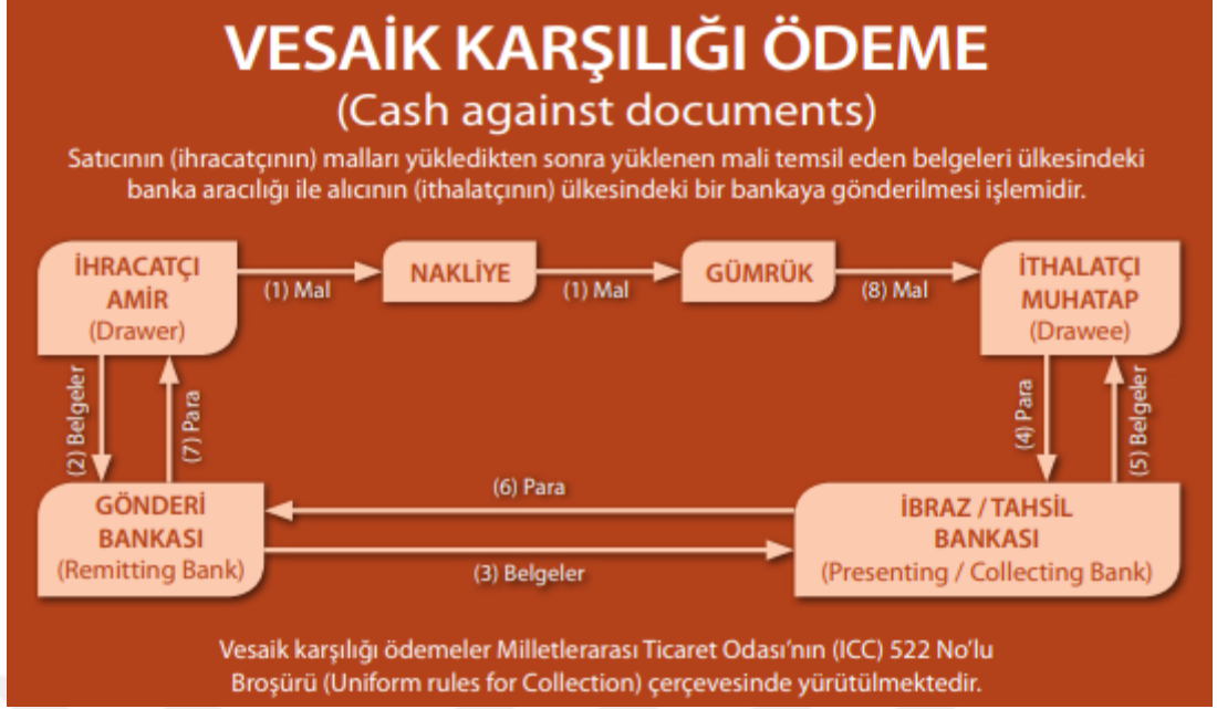
Şekil 1. Vesaik Karşılığı Ödeme