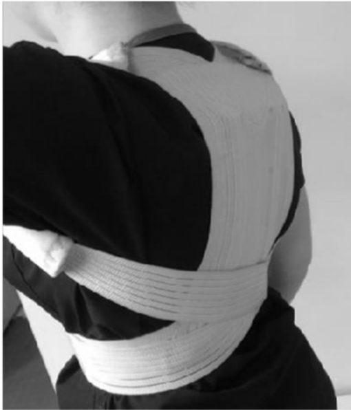
Şekil 2. Omuz retraksiyon ortezi.

sayısı en az 30 kişi (her iki grupta 15 birey) olarak belirlendi. Çalışmada olası kayıplar göz önünde bulundurularak toplam 33 kişi dahil edildi. Verilerin homojen dağılıp dağılmadığını Kolmogorov Smirnov testi ile bakıldı. Homojen dağılan eğitim öncesi veya sonrası verilerin gruplar arası karşılaştırılmasında t testi