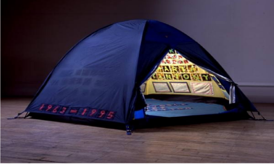
Görsel 4: Tracey Emin, Everyone I have Ever Slept With 1963-95

Zaman ve mekandan bağımsız, çağdaş sanat eserlerini belirleyen en önemli belirteç hız faktörü olmuştur. Sanat eserleri hızlıca üretilmekte ve hızlıca tüketilmektedir. Tracey Emin'in "Everyone I Have Ever Slept With 1963-95" isimli eseri doğduğundan bu yana birlikte uyuduğu kişilerin isimlerini işlediği mavi bir çadır enstalasyonudur (Ozgur,2014). Saatchi koleksiyonunda olan eser 1997'de Saatchi koleksiyonundan derlenen Sensation Sergisinde sergilenir. 2004 yılında, bulunduğu sanat deposunda çıkan yangında yok olur (Görsel 3).