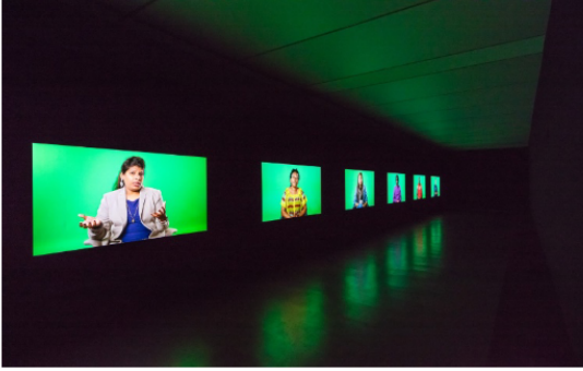
Görsel 6: Candice Breitz, Love Story, Video Enstalasyon, 2016

Sanat dili çağın teknolojik olanakları ile enstalasyon, medya sanatı veya dijital sanatın ağırlıkta olduğu bir görünüm kazanmaya başlamıştır (Görsel 5,6).