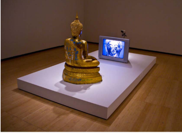
Görsel 1: Golden Buddha, 2005, Video enstalasyon, Gagosian Galeri

Çağdaş sanat dönemi sanatla piyasanın birbirine çok yaklaştığı dönemlerden biridir. Günümüzde medya, reklam ve sanat birbirinin ayrılmaz parçası olarak sanayi kurumu şeklinde çalışmaktadır. Küresel dünya düzeninde sanat, bir yatırım aracı, kültürel bir aracı ve sistemin kendini meşrulaştırma aracı olarak kullanılabilir. (Tunçelli, 2014, 69-70). Ali Artun'a göre kültürün ekonomikleşmesi ile sanat önce bir iletişim diline indirgenmekte oradan da şirketlerin kurumsal kültürlerine eklenmek üzere yönetim birimlerine soğurulmaktadır. Böylece sanat, başarı kriterleri piyasaya göre belirlenmiş şirkete dönüşmektedir. Avrupa Kültür Vakfı'nın (ECF) yayınladığı "Sarsıntılı Zamanlarda Sanat Yönetimi" Kılavuzunda "Kültürel Politikanın Kilit Başlığı" altında belirlenen modelde "Sanat ürünü başka herhangi bir üründen farklı değil; dolayısıyla başarısı da ancak piyasadaki başarısıyla ölçülebilir."denmektedir (Artun, 2015, 46-48). Sanat ve yaratıcılık, küreselleşme ile kültürel ekonomiye dahil olmakta, piyasanın yönetiminde işleyen bir finans aracına dönüşmektedir.