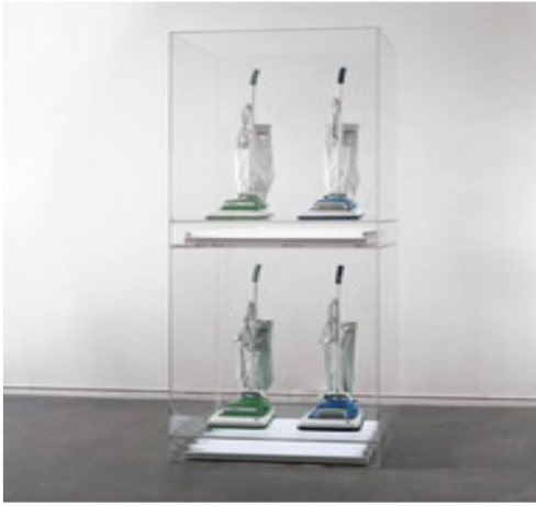
Görsel 3: Jeff Koons, New Hoover Convertibles

Jeff Koons'un, yanlarında floresan tüpleriyle pleksiglas bir kutuya yerleştirilmiş elektrik süpürgelerinin yer aldığı eseri Sotheby's'de satışa sunularak 2,16 milyon dolara satılır (Görsel 2). Müzayede kataloğunda eserin "toplumsal cinsiyet rollerinin yanı sıra tüketimciliği konu edindiği" belirtilmiştir (Thompson, 2012, 42).