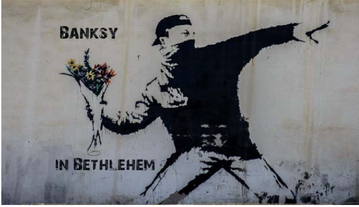
Görsel 8: Banksy, The Flower Thrower, 2005

Çağdaş sanat siyasetle çok yakından ilişkilidir. Çağdaş sanat-siyaset ilişkisi protest sanat, aktivist sanat başlıkları altında incelenebilir. Sanatçı, siyasi veya küresel sorunu, grafiti, sokak sanatı, yerleştirme, performans sanatı gibi disiplinlerarası alanlarda mesaja dönüştürür. Gerçek kimliği bilinmeyen, dünyanın birçok yerinde yaptığı grafitilerle protest ve aktivist tavır sergileyen Britanya'lı sanatçı Banksy, İsrail'in Filistinle arasına ördüğü Batı Şeria duvarının tam karşısında bir otel satın alır. "Walled off Hotel" adını verdiği ve bazı duvarlarında resimlerinin bulunduğu otel Filistin-İsrail sorununa dikkat çeker. Banksy'nin Kudüs'te bir garaj yanındaki duvara stensil ve sprey boyalarla yaptığı "The Flower Thrower" ikonik bir duvar resmidir. Banksy'nin kendi kitabı Wall and Piece'in kapağıdır.