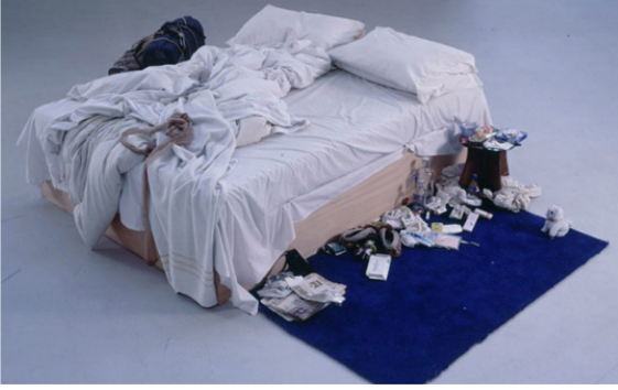
Görsel 5: Tracey Emin, My Bed,1999

Sanat dili çağın teknolojik olanakları ile enstalasyon, medya sanatı veya dijital sanatın ağırlıkta olduğu bir görünüm kazanmaya başlamıştır (Görsel 5,6).