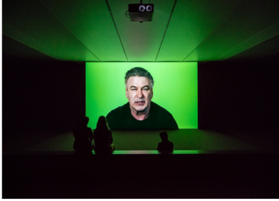
Görsel 7: Candice Breitz, Love Story, Video Enstalasyon, 2016

Candice Breitz küresel bir soruna, mülteci sorununa, ülkesini terk eden altı farklı kişi ile röportaj yaptığı “Love Story” video enstalasyonu ile dikkat çekiyor. Video gösterimi iki farklı odada yapıyor. Kurulumun ilk odasında, bu zorunlu göç hikayeleri, iki sanatçı Alec Baldwin ve Julianne Moore tarafından geniş bir ekrana aktarılıyor. İkinci bir alanda, orijinal görüşme görüntüleri altı monitörde görülüyor, mültecilerin her biri kendi deneyimlerini anlatıyor (Museum of fine arts, 2018). Küresel ölçekli sorunlar dijital teknolojinin tüm imkanları kullanılarak sanata malzeme olmaktadır. Sanat aracılığı ile küresel sorunlara duyarlılık geliştirilmekte olduğu ve çağdaş sanatın küreselleşme ile çok sıkı bir ilişki içinde olduğu gözlemlenmektedir.