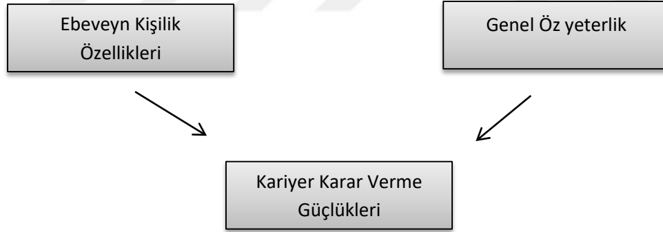
Şekil 1. Araştırmanın Modeli

Bu araştırmanın temel amacı fen lisesi öğrencilerinin kariyer karar verme güçlüklerinin yordanmasında genel öz yeterliğin (General Self-Efficacy) ve ebeveyn kişilik özelliklerinin rolünü incelemektir. Araştırmanın bağımlı değişkeni kariyer karar verme güçlükleri, bağımsız değişkenleri ise genel öz yeterlik ve ebeveyn kişilik özellikleridir. Ayrıca bu çalışmada, fen lisesi öğrencilerinin kariyer karar verme güçlük düzeylerinin cinsiyete, sınıf düzeyine ve ailelerinin aylık gelir düzeyine göre anlamlı olarak farklılaşıp farklılaşmadığını incelemek amaçlanmaktadır.