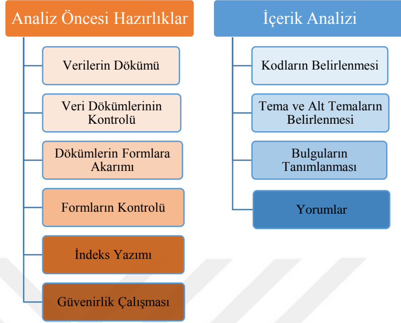
Şekil 1. Veri Analizi